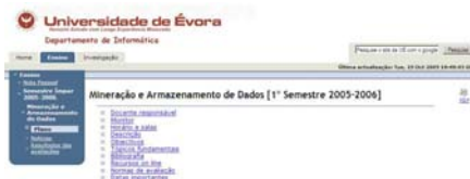
Figura 2: Exemplo de uma página com publicação do plano semestral de uma disciplina