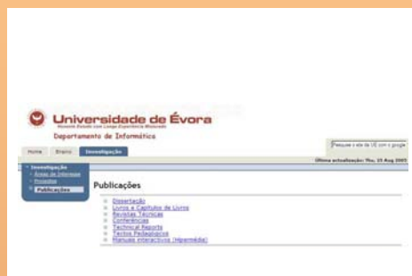
Figura 3: Exemplo de aplicação da arquitectura a um conjunto de publicações